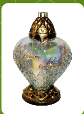
Z-22 | 20 zł ± 38 cm ~72 h