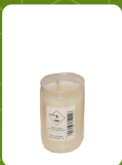
WO-1 | 2 zł