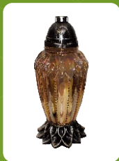
Z-21J | 17 zł ± 34 cm ~80 h