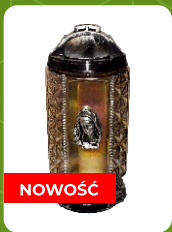
Z-21A | 18 zł ± 32 cm ~72 h