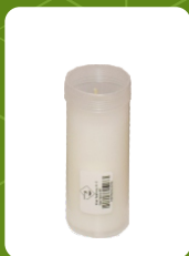
W-5 | 2 zł