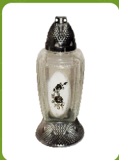
Z-18 | 9 zł ± 30 cm ~56 h