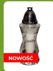
Z-3P | 7 zł ± 27cm ~36 h