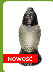
Z-16 | 6 zł ± 25 cm ~40 h