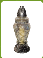
Z-19P | 12 zł ± 34 cm ~72 h