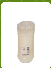
WO-2 | 2,5 zł