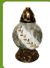
Z-3 | 9 zł ± 27 cm ~36 h