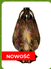
Z-21 | 17 zł ± 32 cm ~72 h