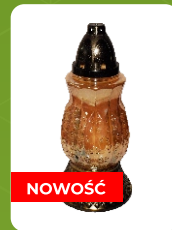
Z-6Z | 7 zł ± 25 cm ~40 h