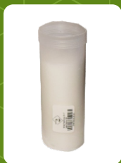
W-7 | 2,5 zł