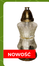
R-74N | 8 zł ± 33 cm ~60 h