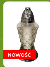
Z-7R | 8 zł ± 28 cm ~72 h