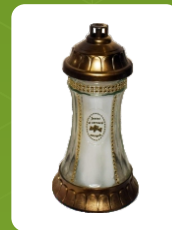
Z-5 | 7 zł ± 25 cm ~40 h