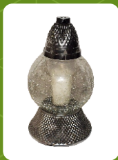
M-3 | 15 zł ± 37 cm ~76 h