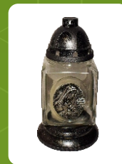
R-77C | 12 zł ± 32 cm ~90 h