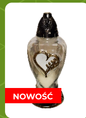
Z-4 | 10 zł ± 33 cm ~60 h