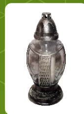
Z-20 | 9 zł ± 38 cm ~72 h