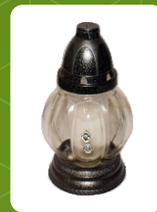
Z-6K | 5 zł ± 21 cm ~36 h