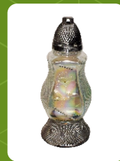
P-1A | 9 zł ± 33 cm ~60 h