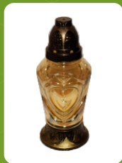
P-57 | 5,5 zł ± 24 cm ~40 h