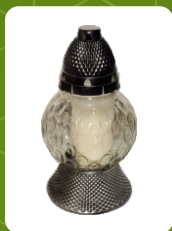
Z-2 | 5 zł ± 20 cm ~80 h