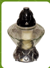
Z-16W | 7 zł ± 22 cm ~40 h