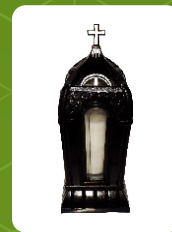
Z-R | 19 zł ± 32 cm ~50 h