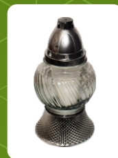
P-33 | 3,5 zł ± 18 cm ~30 h