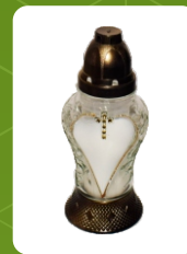
P-2Z | 4 zł ± 21 cm ~40 h