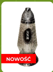
Z-5 | 7 zł ± 30 cm ~56 h