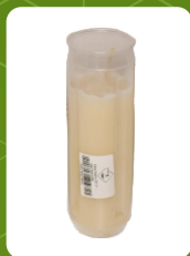
WO-3 | 3 zł