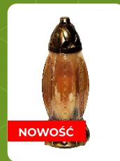
P-1R | 8 zł ± 27 cm ~36 h