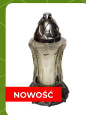
Z-8 | 6 zł ± 25 cm ~40 h