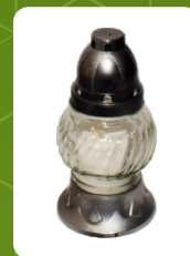
P-35 | 2,5 zł ± 16 cm ~24 h