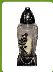
Z-KA3 | 17 zł ± 38 cm ~80 h