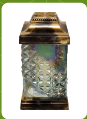
Z-34 | 16 zł ± 26 cm ~48 h