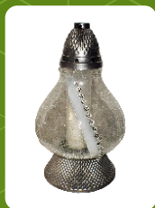
Z-21M | 20 zł ± 37 cm ~80 h