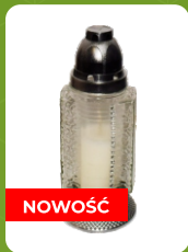
Z-9 | 5,5 zł ± 24 cm ~40 h