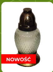
Z-12S | 3,5 zł ± 16 cm ~24 h