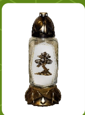
Z-21R | 16 zł ± 38 cm ~72 h