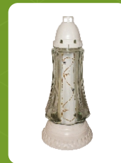
Z-SB | 11 zł ± 35 cm ~70 h