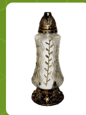
R-77M | 12 zł ± 35 cm ~72 h