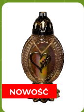
Z-21S | 17 zł ± 34 cm ~72 h