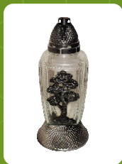
Z-18D | 16 zł ± 31 cm ~56 h